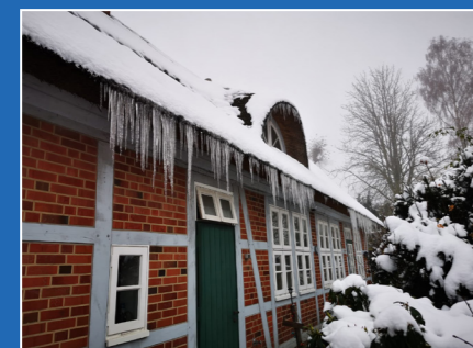
Das Hamwarde Pastorat am Nikolaustag 2023

KU 2025 dienstags, 17:00-18:30 Uhr 09.01. + 23.01. Hamwarde 13.02. + 27.02. Hamwarde 12.03. Lüttau 26.03. Hamwarde